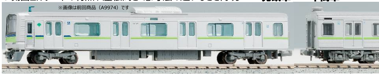
※画像は前回商品 (A9974) です